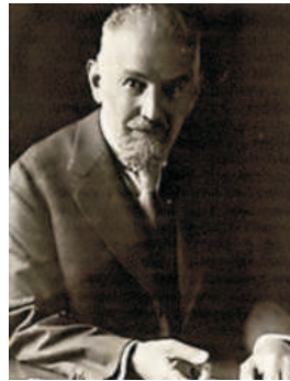
William Stern (1871-1938) Begründer der Differenziellen Psychologie und Erfinder des ersten Intelligenzquotienten

Dieser "moderne IQ" ist aber nicht mit Maßeinheiten wie Zentimeter, Minuten, Stundenkilometer oder Kilogramm vergleichbar. Bei den genannten Maßeinheiten, mit denen wir im Alltag ständig umgehen, sind Aussagen über die Relation unterschiedlicher Werte zulässig und sinnvoll. So kann man eben nicht nur sagen, dass zwei Kilogramm Karotten mehr sind als ein Kilogramm, sondern dass es sich exakt um die doppelte Menge handelt; anders ausgedrückt um "hundert Prozent mehr". Wenn eine Frau 160 cm groß ist, und ihr Mann 176