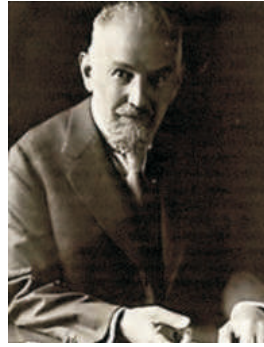
William Stern (1871-1938) Begründer der Differenziellen Psychologie und Erfinder des ersten Intelligenzquotienten

Dieser "moderne IQ" ist aber nicht mit Maßeinheiten wie Zentimeter, Minuten, Stundenkilometer oder Kilogramm vergleichbar. Bei den genannten Maßeinheiten, mit denen wir im Alltag ständig umgehen, sind Aussagen über die Relation unterschiedlicher Werte zulässig und sinnvoll. So kann man eben nicht nur sagen, dass zwei Kilogramm Karotten mehr sind als ein Kilogramm, sondern dass es sich exakt um die doppelte Menge handelt; anders ausgedrückt um "hundert Prozent mehr". Wenn eine Frau 160 cm groß ist, und ihr Mann 176