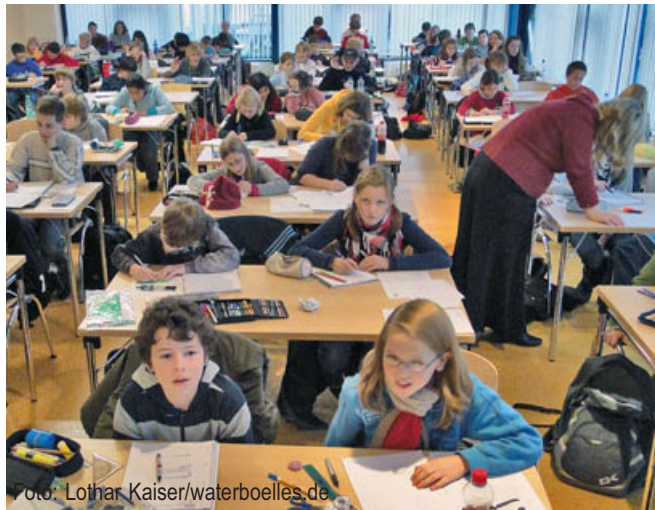
Mathetest Pisastudie 2009

Das Kaugummikauen ist für alle Situationen günstig, in denen Informationen aufgenommen und verarbeitet werden sollen, während sich der Schüler in einem schläfrigen oder entspannt wachen Zustand befindet. Durch das Kauen erhöht sich Aktivationsniveau in die Richtung der vollen Wachheit. In diesem Zustand können maximale geistige Leistungen erbracht werden.